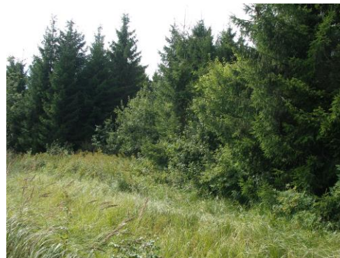
Fotod planeeringu alast

Kungla mets 2 katastriüksus (katastritunnus 29501:007:0314) suurusega 11,89 ha, sihtotstarbega 100% maatulundusmaa, millest haritav maa moodustab 0,02 ha, looduslik rohumaa 3,49 ha, metsamaa 6,75 ha ja muu maa 1,63 ha.